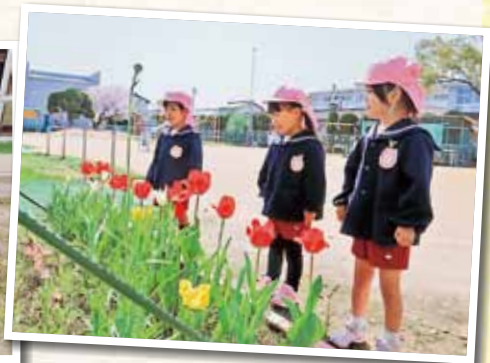
岡山市立可知幼稚園