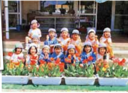
西粟倉村立西粟倉幼稚園