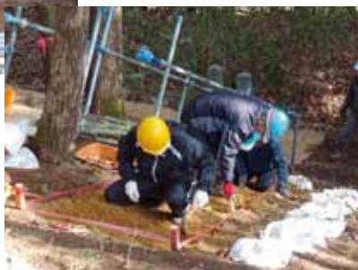
後円部斜面での作業(赤線のヘルメットは係の班長)