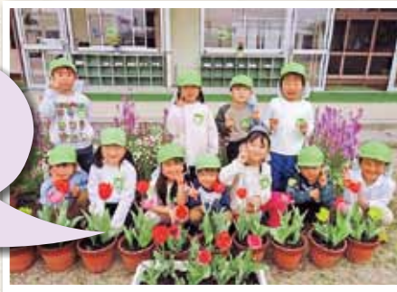
岡山市立大野幼稚園