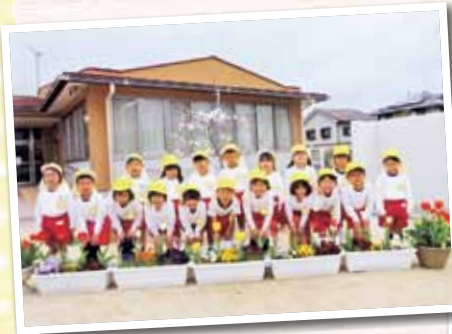
赤磐市立ひかり幼稚園

中学校のお兄さん、お姉さんと一緒にチューリップの球根を植えました。チューリップの芽が出て、つぼみとなり、花が咲く度に、植えた時の楽しい交流を思い出しては話題にしています。進級して2日目のキラキラの笑顔です。