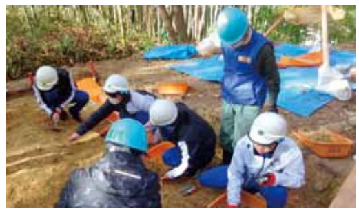
中学生が参加しての発掘作業(掘り下げ)