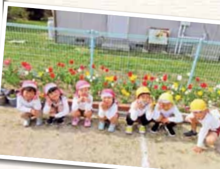
倉敷市立蘭幼稚園