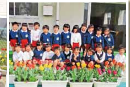
岡山市立吉備東幼稚園

チューリップの絵本を見た後、4歳児が植木鉢に土を入れ、球根を植えました。芽が出ると、「つのみたい。」「ぼくのも。」「私のも。」と、友達と比べながらうれしそうに会話をしていました。始業式の日、登園すると、「チューリップが咲いてる。」「わあ、きれい。」とおうちの人や友達と会話が弾んでいました。