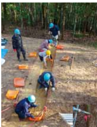
前方部の発掘作業(青色ヘルメットは保存会員, 黄色ヘルメットは一般参加者)

古墳にご興味があり、北房の古墳を訪ねてみたいという方がおられましたら、北房文化遺産保存会（〒716-1411真庭市上水田3131北房文化センター内）へご連絡ください。ただ、古墳の見学は秋の終わりから春先までがお勧め。真夏にはお勧めできません。