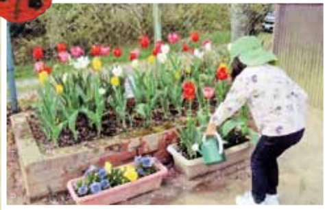
真庭市立木山こども園