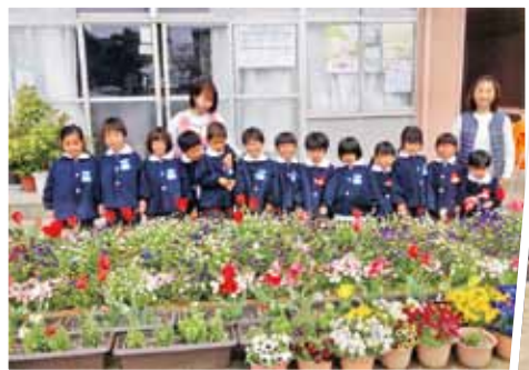
倉敷市立上成幼稚園