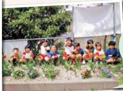
美作市立英田幼稚園

中学校のお兄さん、お姉さんと一緒にチューリップの球根を植えました。チューリップの芽が出て、つぼみとなり、花が咲く度に、植えた時の楽しい交流を思い出しては話題にしています。進級して2日目のキラキラの笑顔です。