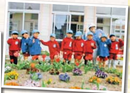
総社市立久代幼稚園