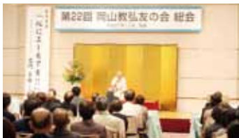
落語家さんによる講演