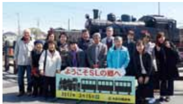
大井川鉄道SL前にて

直虎ゆかりの地を訪れたことで、一層親しみ深くドラマを見ることができています。花鳥園ではたくさんの鳥と触れ合ったり、大井川沿線の豊かな自然を楽しんだり、日本平から美しい富士山を見たりと、大自然を満喫する旅行となりました。一人で参加しても、他の参加者の皆様と仲良くなることができ、とても楽しかったです。