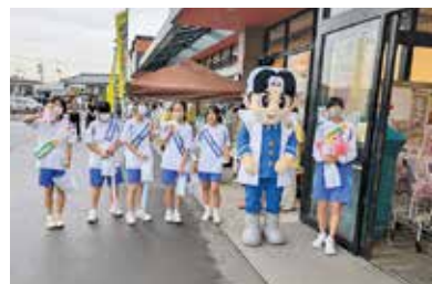
スーパーでの啓発活動

地域の方とのつながりを感じたり、地域に貢献することのよさを感じたりと、参加した生徒は様々な学びをしました。