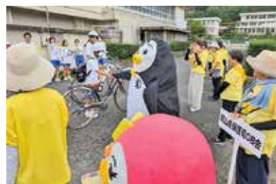
協働でのあいさつ運動

生徒会の取組として、毎月あいさつ運動を行っていますが、7月には社明運動とタイアップして大々的に行います。一堂に会した地域の方は、日頃からあいさつや見守りでお世話になっている方ばかりです。着ぐるみのホゴちゃんと握手をする生徒もいて、朝から和やかな雰囲気になります。