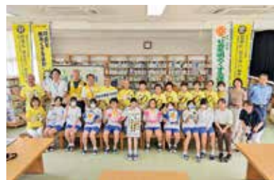
勉強会参加者で記念撮影

本校では、保護司会や更生保護女性会を中心に行われるこの運動に、生徒会を中心として関わっています。コロナ禍には中断していましたが、今年度で7回目になります。