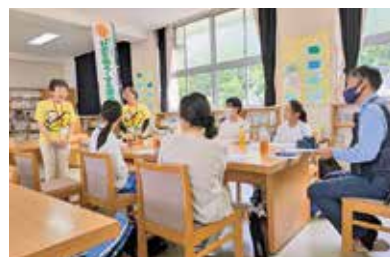
勉強会での一コマ

今年度は、「友達が悪いことをしてしまったらどうする?」というテーマで、大人も中学生も一緒に話し合いをしました。