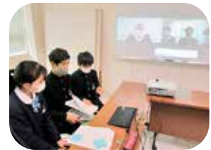
高等学校の生徒会へインタビュー

校則というのはそもそも生徒たちが快適な学校生活を送るためのものである、という本質に目を向けるところからのスタートでした。生徒たちにとっては、規則が緩和されたというより、これからは自分たちで責任を持って判断し行動していくのだ、という決意につながった「校則の見直し」でした。そういう意味でもこれからが大切です。