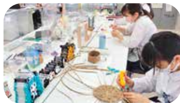
なごみ「共有スペース」 主に創作活動をしませす

生徒一人一人の実態に応じて、社会的自立に向けた支援を行うため、本校では令和2年度に自立支援室『なごみ』が設置されました。生徒一人一人が、将来のことなどを自分のペースでじっくり考えるための「場所」と「機会」を提供しています。