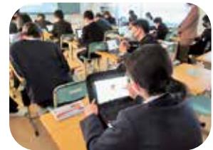
総会では意見の集約などにタブレットを活用しました