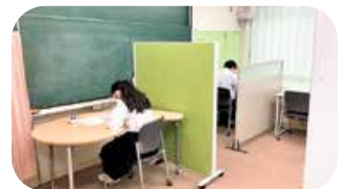
なごみ「チャレンジスペース」 主に学習活動をしませす