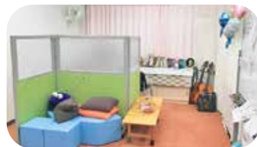
なごみ「コンフォートスペース」 主に自分の時間を過ごします