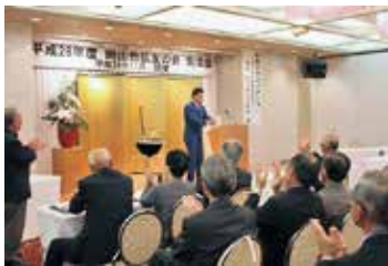
交流会・マジックショー

平成28年度からの新規事業として、総会を開催しない年度に、岡山市内以外で、交流会と一日研修旅行を企画・実施しています。