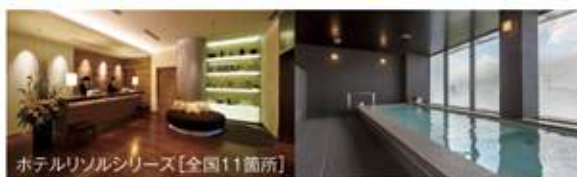
ホテルリソルシリーズ[全国11箇所]

日本旅行、名鉄観光、京王観光、東武トップツアーズでパッケージツアーの割引利用が可能です。