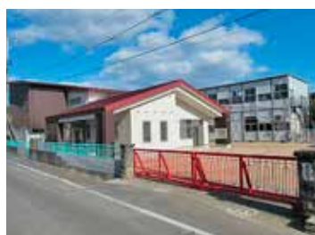
菌幼稚園園舎外観

本園は、倉敷市真備町北部の閑静な農村地にあります。昭和50年4月に、真備町立幼稚園として開園し、平成17年8月に市町村合併に伴い、倉敷市立の公立幼稚園となりました。