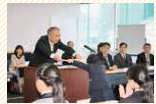
昨年度の展示会と表彰式