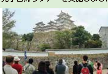
一日研修旅行・姫路

平成28年度の交流会は、津山国際ホテルで 開催し、お笑いマジックショーをお楽しみい ただきました♪ また一日研修旅行では、世界遺産『姫路城』 見学日帰りツアーを実施しました♪